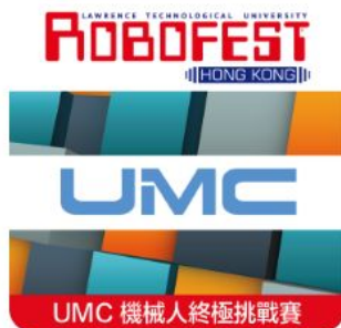
UMC 機械人終極挑戰賽